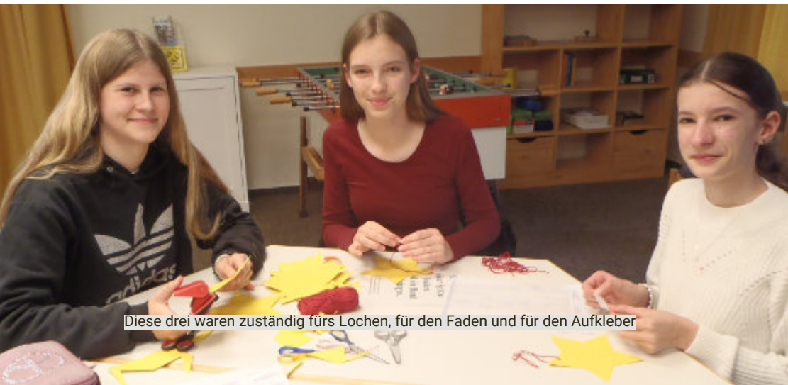
Diese drei waren zuständig fürs Lochen, für den Faden und für den Aufkleber