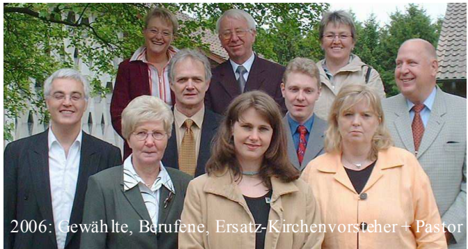
2006: Gewählte, Berufene, Ersatz-Kirchenvorsteher + Pastor

Im Oktober 2010 fand ein Regionaltag statt, an dem sich beide Kirchenvorstände zum ersten Mal im Rahmen einer Gemeindeberatung trafen, um Überlegungen für die regionale Zukunft anzustellen.