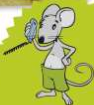
Illustration: der 2. Stern von rechts oben

★ Der Weihnachtsstern: Welcher der Sterne ist wirklich einmalig?