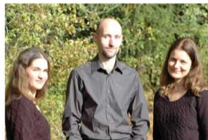
20. Mai 18 Uhr: Ritterhude, Ensemble Widerklang