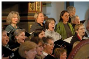
8. April, 10 Uhr: OHZ, Scharmbecker Kantorei

Gottesklang präsentiert Stärken der Kirchenmusik