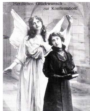
Postkarte zur Konfirmation um die Jahrhundertwende

Einmalig ist mein Fingerabdruck. Einmalig ist meine Stimmfrequenz. Einmalig ist meine Geschichte. Einmalig ist mein Denken und Fühlen Einmalig ist mein Tun und Lassen. Einmalig ist mein Glauben und Lieben. Einmalig ist mein Hoffen und Bangen. Keiner kann es bezweifeln: Ich bin ein originaler Gedanke Gottes. Ich bin ein einmaliges Geschöpf. Ich bin ein Unverwechselbarer. Ich bin bei meinem Namen gerufen. Ich bin mein Name. Ich bin. Ich. Gott sei Dank! (Heinz Gerlach)